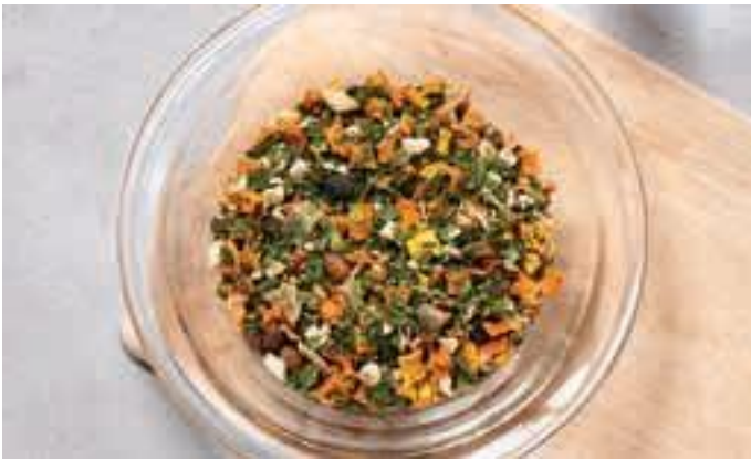
Canis Extra Top-Fit-Mix – graanvrije vlokken

van rauw vlees, aangevuld worden met fruit/groenten of een lucht gedroogde vlokkenmix. Wij bieden je Canis Extra Vit/Min-Vlokken of Canis Extra Top-Fit-Mix, de graanvrije vlokkenmix. Afhankelijk van het feit of er ook rauw bot wordt gevoed, worden een natuurlijke calciumbron, zoals bijv. onze Canis Extra Biologische Eierschalenpoeder, en een hoogwaardige dierlijke of plantaardige olie, zoals bijv. Canis Extra Zalmolie of Canis Extra Biologische Hennepzaadolie, toegevoegd.