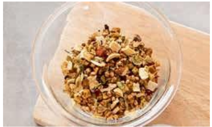
Canis Extra Vit/Min-Vlokken - met gepofte gierst

Het is vooral belangrijk bij het voeden van pups dat ze alles krijgen wat ze nodig hebben voor een gezonde groei - je kunt alle belangrijke supplementen hier vinden: